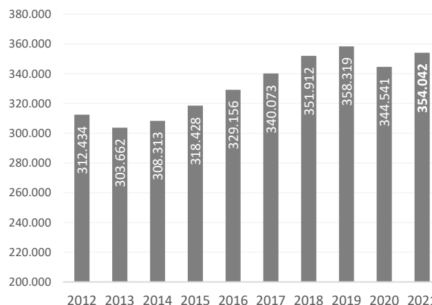
Afiliats per residència padronal. 30 de juny. Total.

Respecte al mateix trimestre previ a la pandèmia (juny 2019), el nombre d'afiliats augmenta un 6,8% entre els de 45 anys o més, mentre que disminueixen un 7,8% entre els menors de 45 anys.