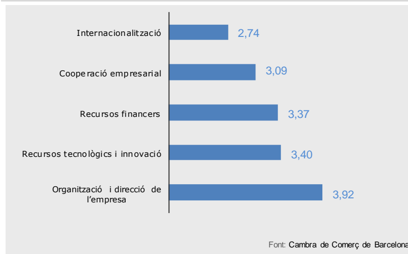
Gràfic 2. Com valora els següents factors de competitivitat interns de la seva empresa? (1 = deficient; 5 = molt favorable)

En general, la indústria és el sector que fa una valoració més positiva dels seus factors de competitivitat interns , mentre que la construcció i els serveis són els que fan una valoració més baixa.