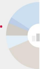
Taula 23. Saldos comercials amb l'estranger (II)