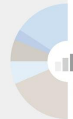
Taula 45. Taxes d'estalvi i d'inversió: % PIB